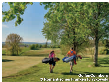
Golfen Colmburg

Alle Informationen zum Radfahren, Wandern und Golfen gibt es auf der Webseite www.romantisches-franken.de