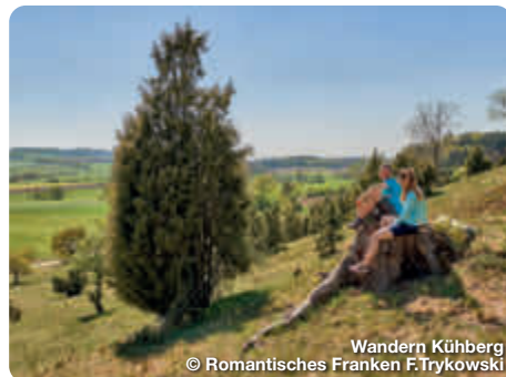
Wandern Kühberg

Ein großes Netz an Wanderwegen durchzieht den Naturpark Frankenhöhe. Rund um den Hesselberg kann man mit herrlicher Aussicht wandern. Rund um die historischen Städte von Dinkelsbühl, Feuchtwangen und Rothenburg o.d.T. stehen eigene Wegenetze bereit. Mit Geschichte wandern geht man auf dem KulturWanderweg Hohenzollern zwischen Rosstal und Langenzenn. Bei Stein und Zirndorf ist der Wanderweg Wallensteins Lager eine schöne Mischung aus Naturerlebnis und Geschichtspfad.