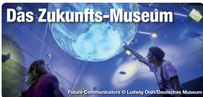
Future Communicators

Zukunft zum Anfassen. Im Deutschen Museum Nürnberg wartet schon heute die Welt von morgen Wie werden wir in 10, 20 oder 50 Jahren leben? Wie entwickelt sich Technik weiter - und vor welche Herausforderungen stellt uns das als Gesellschaft? Was wünschen wir uns? Welche Befürchtungen haben wir? Die Zweigstelle des Deutschen Museums im Herzen der Nürnberger Altstadt lädt zu einem spannenden und aufschlussreichen Blick in die Zukunft ein. Die Grundkonzeption einer Gegenüberstellung von „Science“ und „Fiction“ zieht sich dabei als roter Faden durch alle Bereiche der Ausstellung. Hier werden konkrete Projekte aus der aktuellen Forschung vorgestellt, die vielleicht schon morgen unser Leben beeinflussen könnten.