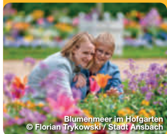
Blumenmeer im Hofgarten

Der Hofgarten südöstlich der Residenz ist im französisch-barocken Stil gehalten. Die Anfänge des Gartens reichen in das 16. Jahrhundert zurück. Der Leonhart-Fuchs-Garten ist dem ehemaligen Leibarzt des Markgrafen und „Vater der Botanik“ Leonhart Fuchs gewidmet. Außerdem erinnert im Hofgarten ein Gedenkstein an die Stelle des Attentats auf Kaspar Hauser, dem berühmtesten Findelkind der Geschichte. Architektonischer Mittelpunkt des Hofgartens ist die schlossartige Orangerie, die 1726 bis 1728 von Carl Friedrich von Zocha nach französischen Vorbildern errichtet wurde. Promenade 33, Ansbach