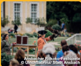
Ansbacher Rokoko-Festspiele